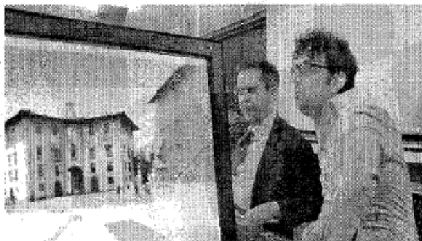
Un momento della presentazione di Visito Tuscany con il sindaco

Somma virtuosa delle tecniche di presentazione visi-